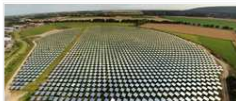
Heliostatenfeld: Über 2000 bewegliche Spiegel

Auf einer Grundfläche von zirka acht Hektar sind 2153 bewegliche Spiegel (Heliostate) mit einer Gesamtfläche von knapp 18.000 Quadratmetern aufgestellt. Diese folgen dem Lauf der Sonne und konzentrieren die Solarstrahlung auf einen rund 22 Quadratmeter großen Receiver, der an der Spitze eines 60 Meter hohen Turms installiert ist. Der Receiver besteht aus porösen keramischen Elementen, die von angesaugter Umgebungsluft durchströmt werden. Die Luft heizt sich dabei auf etwa 700 Grad Celsius auf und gibt die Wärme anschließend in einem Abhitzekegel an den Wasser-Dampfkreislauf ab. Der dort erzeugte Dampf treibt eine Turbine an, die über einen Generator Strom produziert. Das Kraftwerk wird im Nennbetrieb 1,5 Megawatt liefern. In die Anlage integriert ist ein Wärmespeicher, der sich über zwei Stockwerke des Turmes ausdehnt. In diesem Wärmespeicher befinden sich keramische Füllkörper, die von Heißluft durchströmt und dadurch erhitzt werden können. Beim Entladen verläuft der Prozess umgekehrt, der Wärmespeicher gibt seine Energie wieder ab, so dass auch während Wolkendurchzügen Strom produziert werden kann.